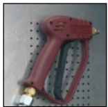
Pistolet de nettoyage