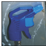
Soufflette d'air comprimé