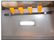
Soufflage vitre et éclairage LED