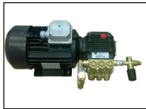
Pompe Haute Pression